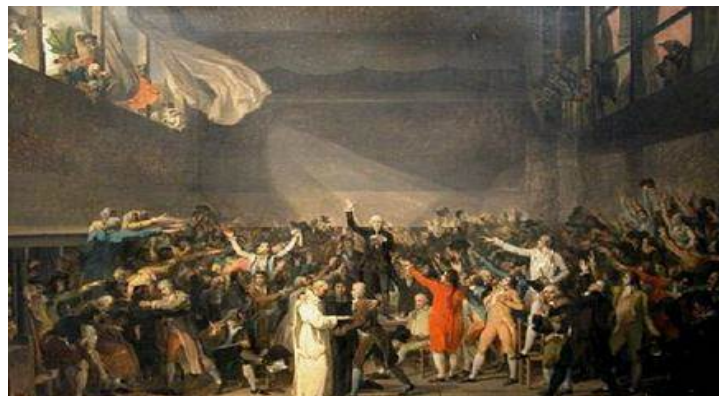
Serment du Jeu de Paume

Après avoir vu se dessiner la pensée politique et philosophique des républiques modernes lors du Moyen Âge et des révolutions anglaises, nous allons consacrer notre travail à la mise en œuvre de ces théories politiques et philosophiques en Amérique et en France. Le paysage contemporain, ses crises théoriques et politiques, ne sont compréhensibles que sur ces fondements. Si le fameux « monde d'après » dont tout le monde parle, que personne ne voit vraiment venir, hésite à se réaliser c'est peut-être que nous restons « piégés » dans des conceptions qui devraient être obsolètes. Une « déconstruction » peut présenter quelques utilités au regard contemporain pour éclairer de modestes lueurs l'horizon qui vient.